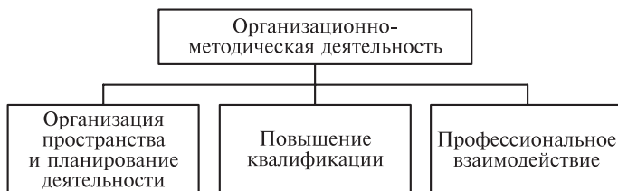
Схема 1.2. Содержание организационно-методической работы в условиях образовательного учреждения

— организация профессионального пространства (оборудование психологического кабинета и других специальных помеще-